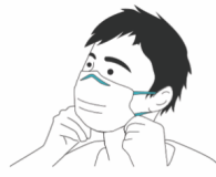
Forsikre deg om at masken dekker munnen, nesen og haken.