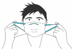
Brett ansiktsmasken ut. Fest elastikken i ørene og stram elastikken.